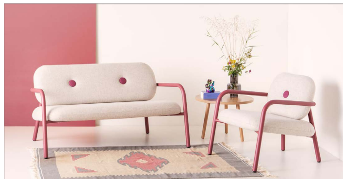
Bold 2-Sitzer-Sofa und Bold Sessel

Der Name 'Bold' bezieht sich auf das markante Design mit dicken, robusten Rohren. Diese stabile Rohrkonstruktion trägt nicht nur zum visuellen Statement des Stuhls bei, sondern bietet auch eine solide und bequeme Basis. Was Bold noch besonderer macht, ist die Verwendung von Restmaterialien aus unserer eigenen Plattenabteilung oder aus zurückgesendeten Platten für Rückenlehne und Sitzfläche, wodurch der Stuhl nicht nur stilvoll, sondern auch eine nachhaltige Wahl ist