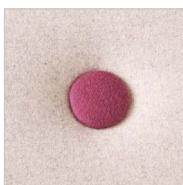
Rückenknopf in Kontrastfarbe